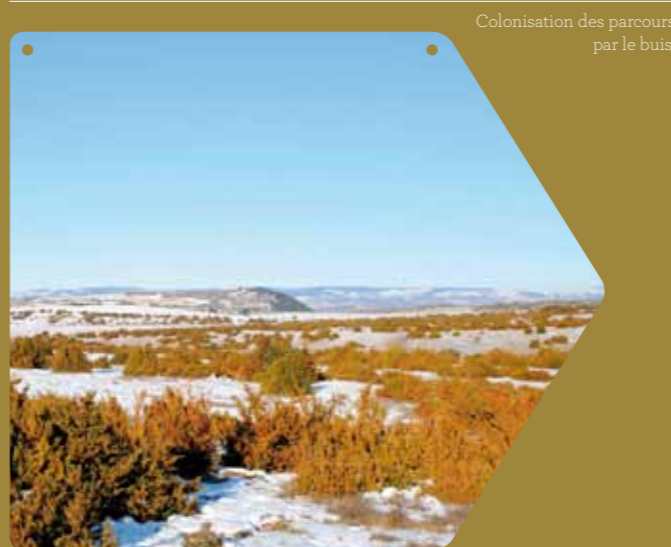
Colonisation des parcours par le buis.

Intégrées au réseau Natura 2000*, les pelouses sèches bénéficient de plan d'actions de conservation de la biodiversité caussenarde avec la participation volontaire des agriculteurs. Comment reconquérir, par le pâturage, des espaces embroussaillés ? Grâce à une gestion adaptée de la ressource disponible (période et pression de pâturage...) et à la mise en place d'équipements pastoraux : pose de clôtures, création de petits parcs de pâturage favorisant les rotations entre les différents secteurs, construction de points d'eau indispensables pour abreuver les animaux tout au long de l'année, mise en place de passages canadiens* et de portillons pour maintenir l'accès aux usagers et visiteurs.