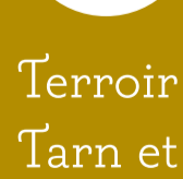
Terroir : « Les Raspes du Tarn et les Marches du Lévezou »