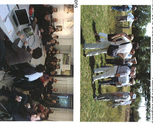
Réutilisation des plaques de prairie du site, maintien de la biodiversité