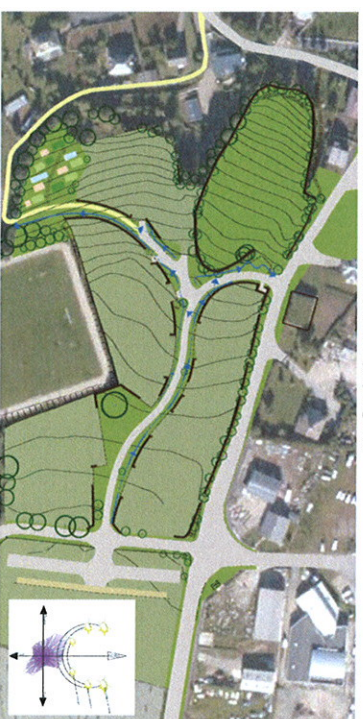
Gestion des eaux pluviales et intégration paysagère