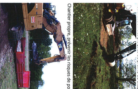
Chantier propre, prévenir les risques de pollutions